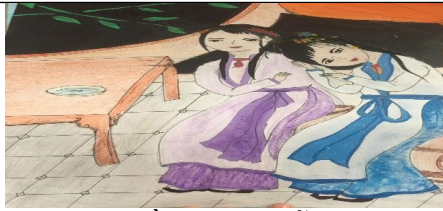
Truyện Kiều – Nguyễn Du