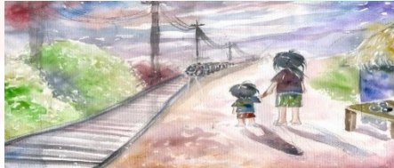
Hai đứa trẻ - Thạch Lam