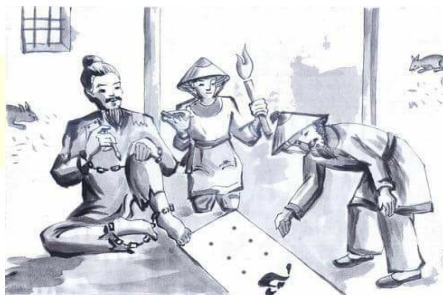
Chữ người tử tù – Nguyễn Tuân

Học sinh trình bày những suy nghĩ của mình về các câu hỏi theo gợi ý.